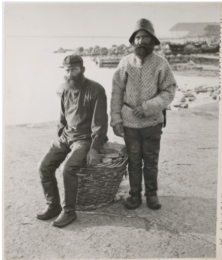
KUVA: Kaksi hylkeenpyytäjää Tammiosta vuonna 1899 2969_99.tif

Kuvan käyttö on luvallista myös kaupallisiin tarkoituksiin, mutta kuvaaja ja omistava organisaatio (=Museovirasto) tulee mainita.